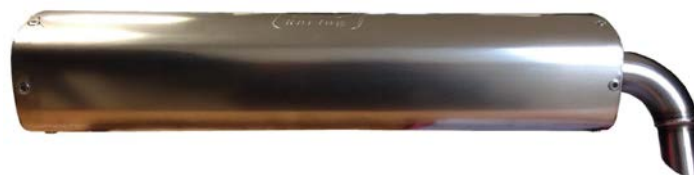
PHOTO DE CÔTÉ PHOTO OF THE SIDE

Signature et tampon de l'ASN Signature and stamp of the ASN