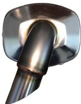
PHOTO DE L'AVANT PHOTO OF THE FRONT

This Homologation Form reproduces descriptions, illustrations and dimensions of the exhaust silencer at the moment of the CIK-FIA homologation and of the homologation test. The Manufacturer may modify them, but only within the limits fixed by the CIK-FIA regulations in force.