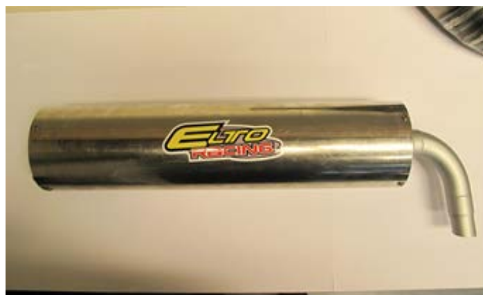
PHOTO DE CÔTÉ PHOTO OF THE SIDE

Signature et tampon de l'ASN Signature and stamp of the ASN