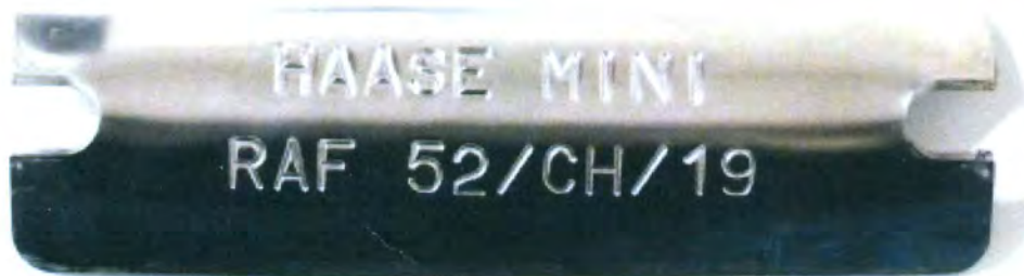
Фотография регистрационной таблички (Photograph of Homologation Number marking)