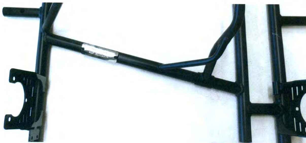
Фотография/чертеж расположения регистрационной таблички Photograph/drawing of position of Homologation Number marking